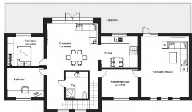
Планировочное решение 2 этаж

Описание: Просторная светлая столовая-гостиная с панорамными окнами и выходом на террасу (терраса с видом на участок и лес), кухня, хозяйственная комната, санузел, гостиная комната, кабинет. Над гаражом вторая гостиная или кинотеатр с выходом на террасу